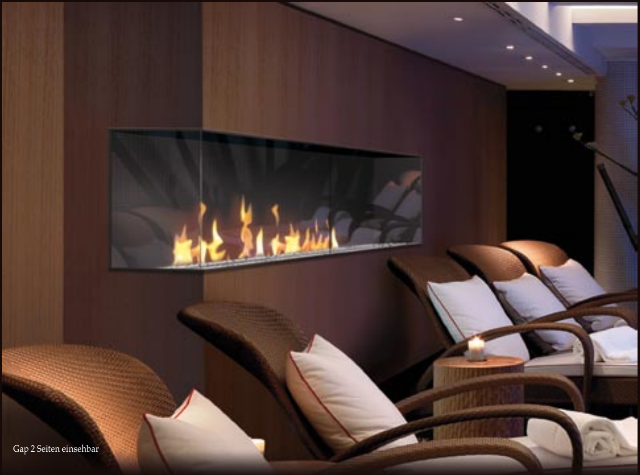
Gap 2 Seiten einsehbar