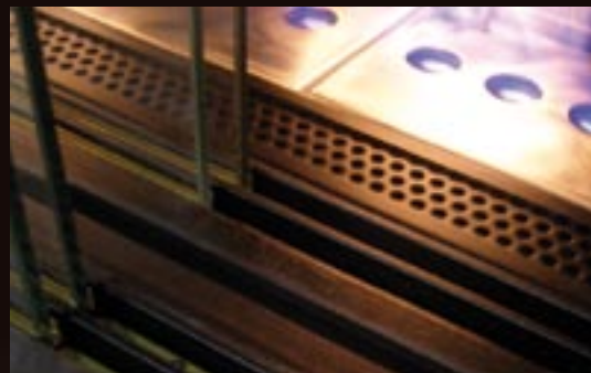
Gap mit Doppelverglasung.