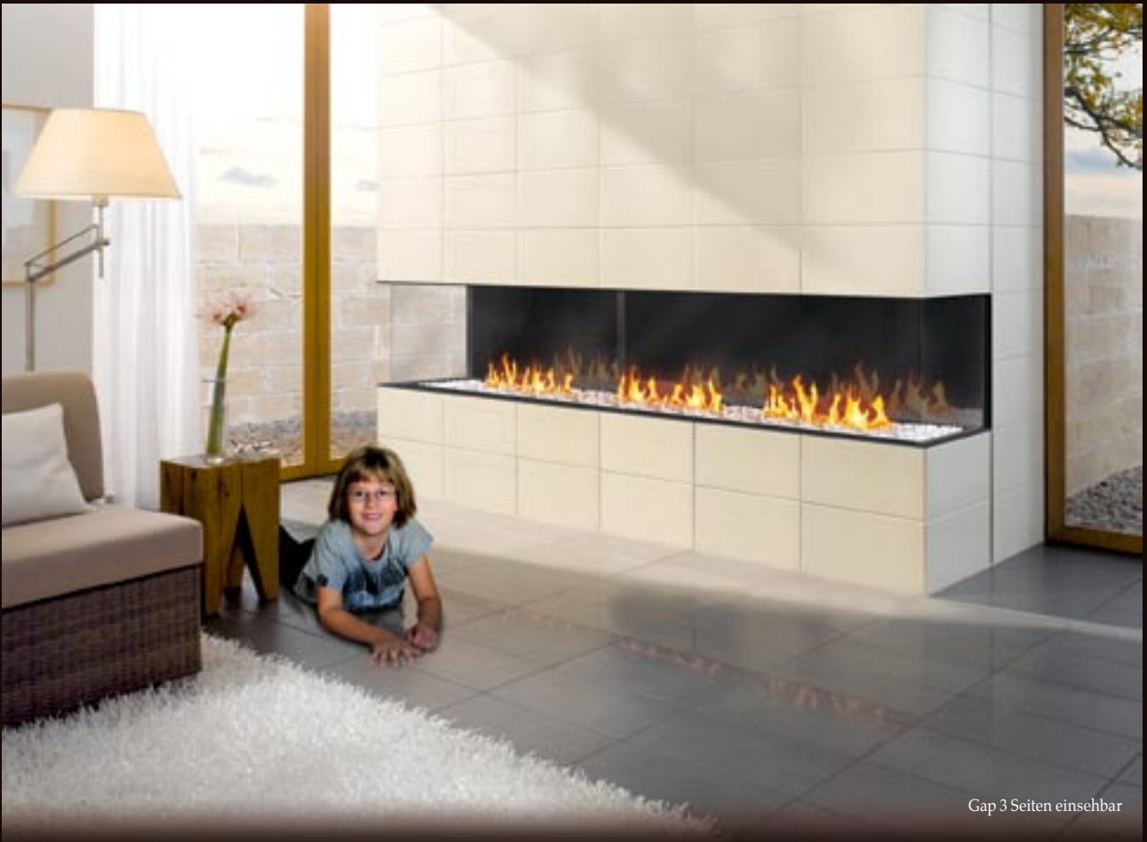
Gap 3 Seiten einsehbar