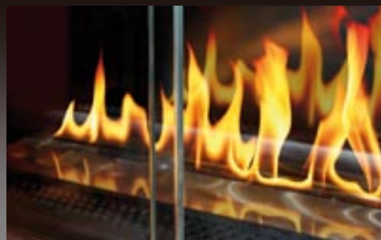
Gap mit Vliesbrenner und spiegelnder Glasrückwand.