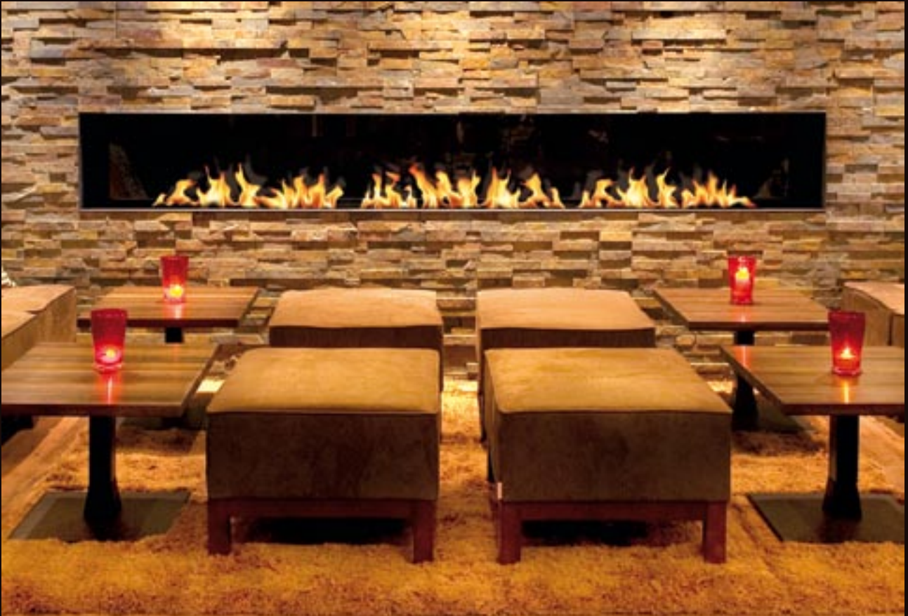
Gap Frontal einsehbar, mit Schiebegläsern geschlossen