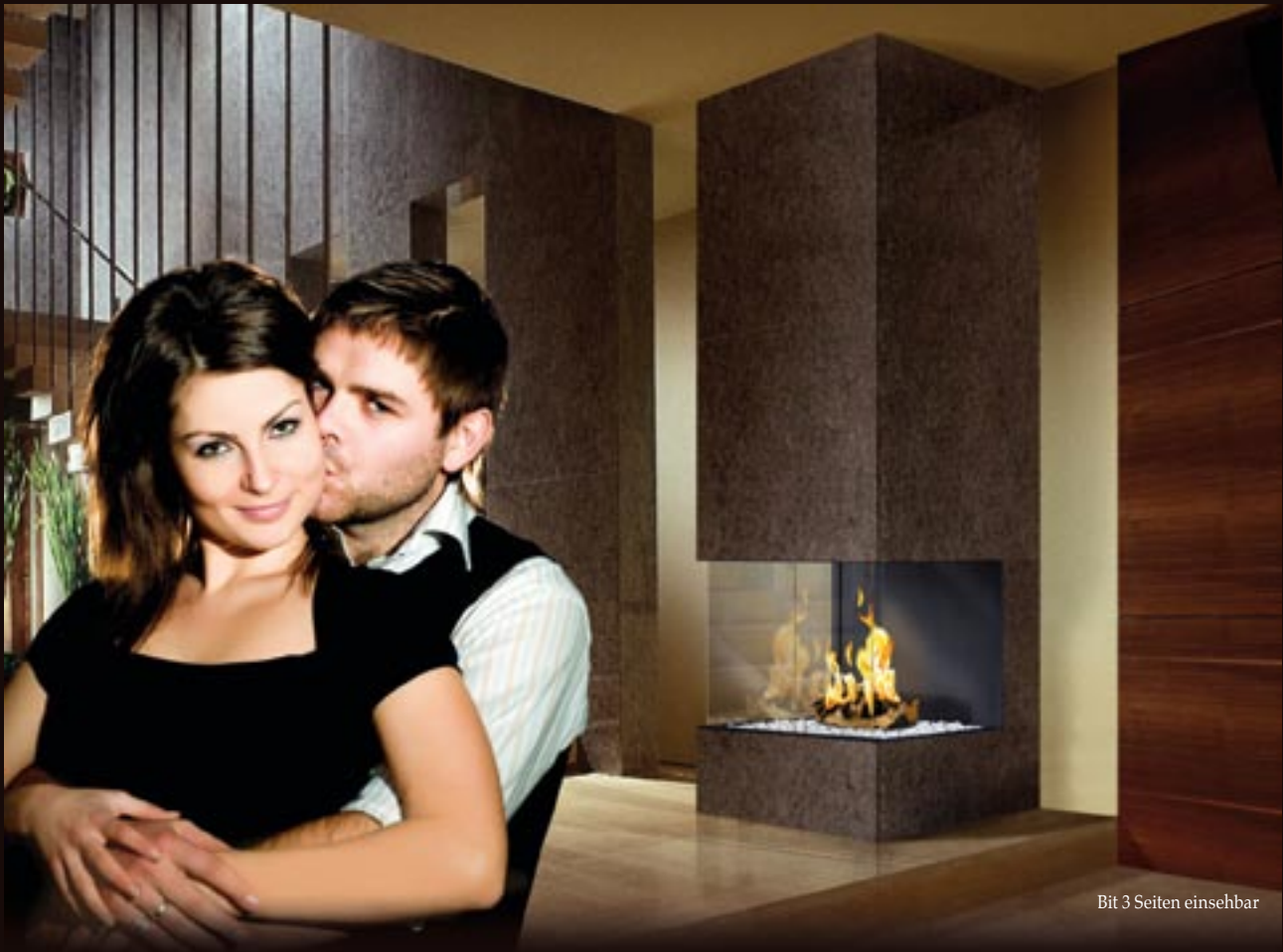
Bit 3 Seiten einsehbar