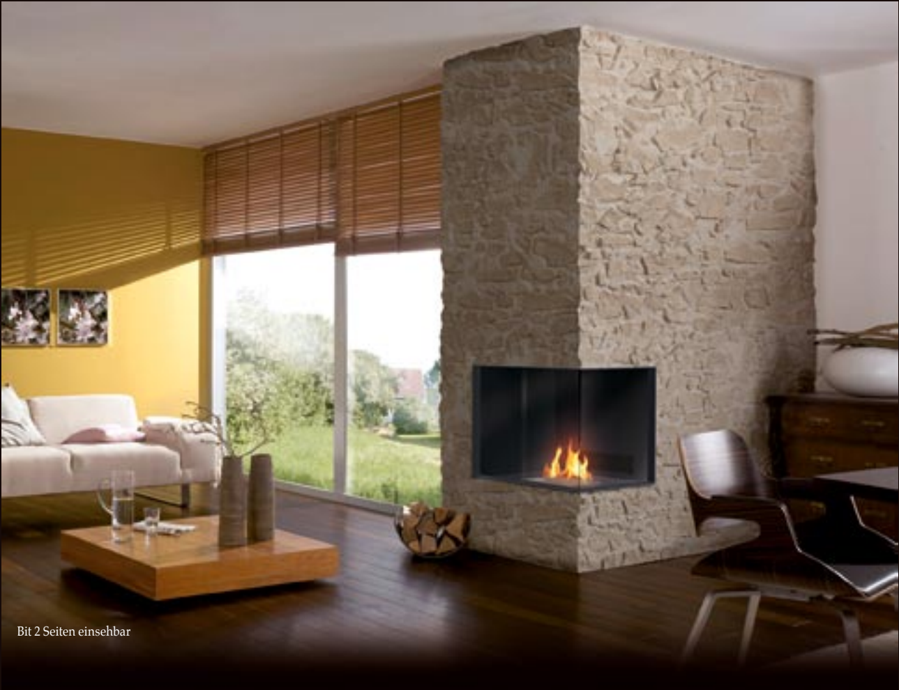
Bit 2 Seiten einsehbar